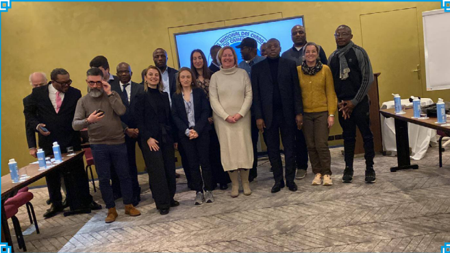
Satisfaction des participants aux travaux