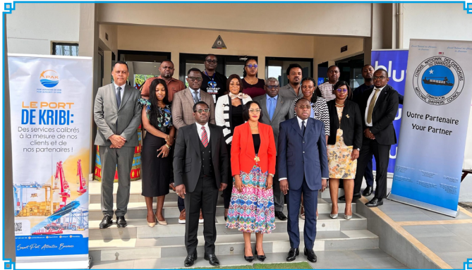
CWEIC Strategic Partners