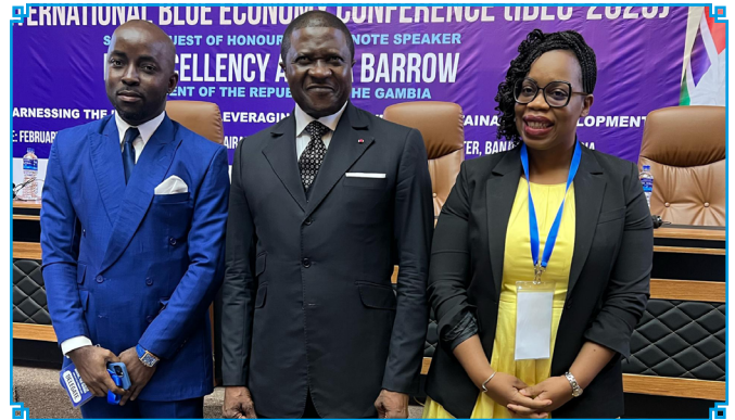
La délégation du Cameroun à Banjul