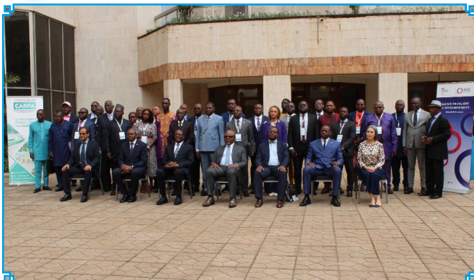
Les participants aux travaux