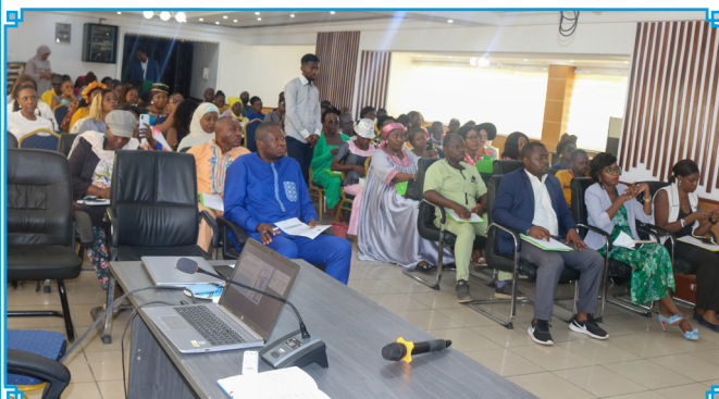
Participants at the training workshop