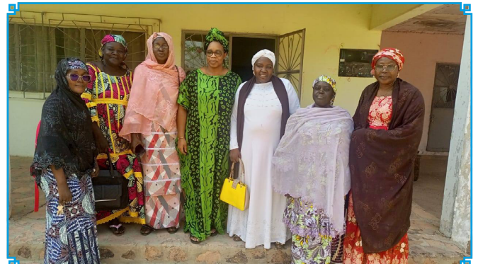
Le satisfecit des participantes