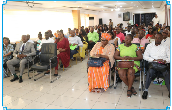
La formation en cours