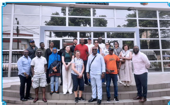
Canadians on guided tour