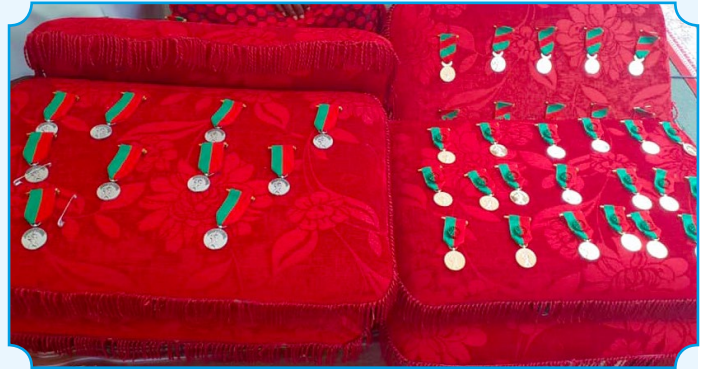
Une vue de quelques médailles

M. Grégoire OWONA, Ministre du Travail et de la Sécurité Sociale a présidé le 20 août 2021 au Club PAD à Douala, la cérémonie de remise de médailles d'honneur du travail au personnel du Conseil National des Chargeurs du Cameroun (CNCC). «Au nom du Président de la République» , soixante-trois (63) employés ont été décorés pour des services rendus. En remettant ces précieuses distinctions, le Ministre a, d'une part, salué la contribution sans cesse croissante du CNCC dans la facilitation des échanges et de l'autre, félicité le personnel pour son abnégation au travail.