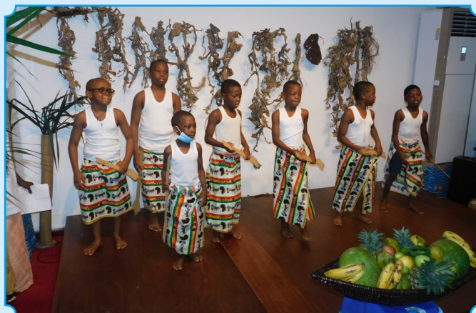
Les enfants sur scène