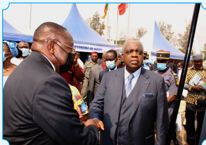
Le Ministre de la Communication dans le stand du CNCC

Durant 07 jours, le CNCC a mené des actions de