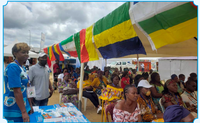
Une vue du stand du CNCC

Outre son stand d’exposition où de nombreux visiteurs ont été édifiés sur les missions, réalisations et projets du CNCC au profit des opérateurs économiques, le CNCC a pris part à plusieurs activités. C’est le cas de l’atelier sur «La Criminalité transfrontalière et Criminalité transnationale» tenu à la sous-