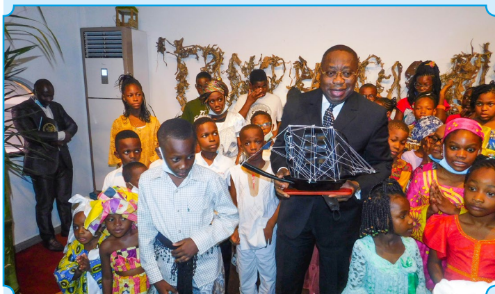
Le cadeau des enfants au Directeur Général- CNCC